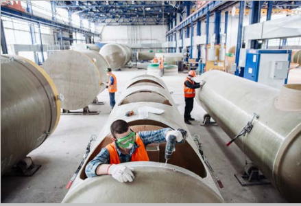
Производство г. Тольятти